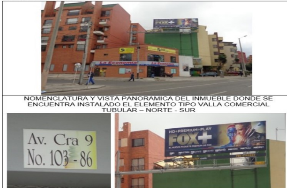
NOMENCLATURA Y VISTA PANORAMICA DEL INMUEBLE DONDE SE ENCUENTRA INSTALADO EL ELEMENTO TIPO VALLA COMERCIAL TUBULAR - NORTE - SUR